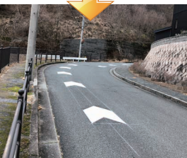
水路障害樹木伐採